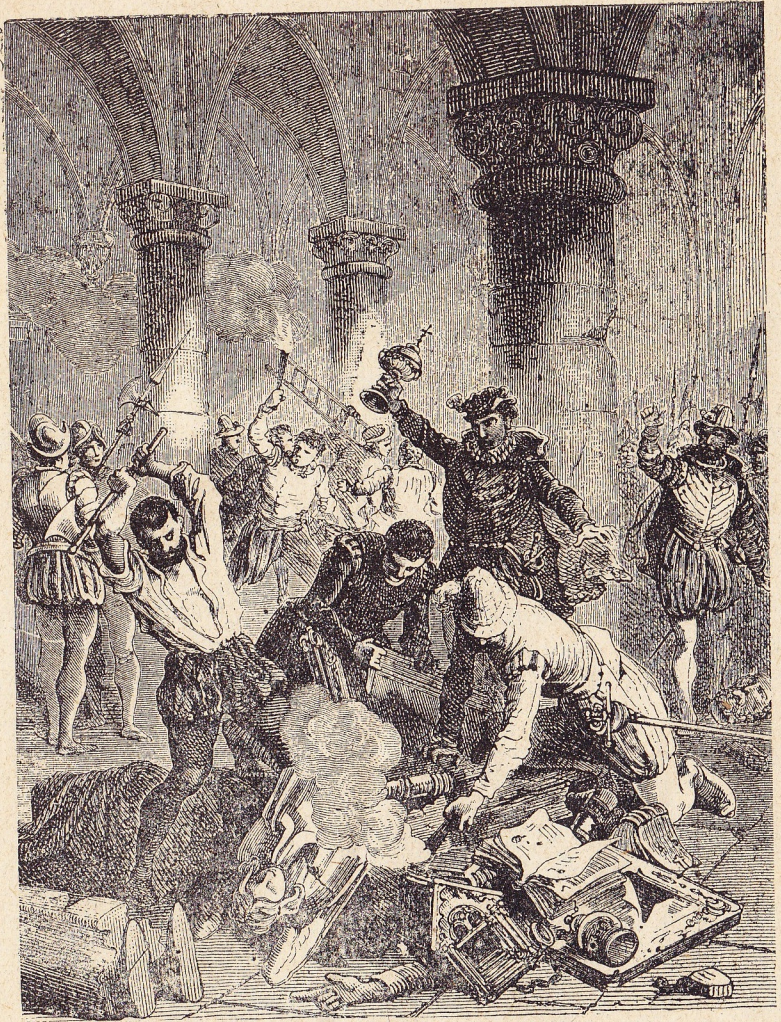
Beeldstormerij in 1566