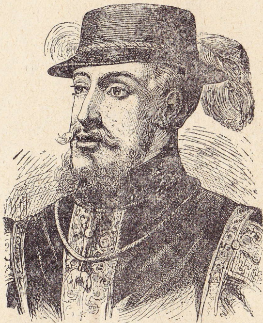
Philips II, zoon van Keizer Karel.

De moedige Egmont lichtte eenige benden uit de bezettingen der Vlaamsche steden, werfde een goed getal landlieden aan en begaf zich met eene macht van min dan 10,000 man naar de grenzen. In het midden der maand Juli verscheen hij eensklaps voor het Fransche leger, dat, met roof beladen,